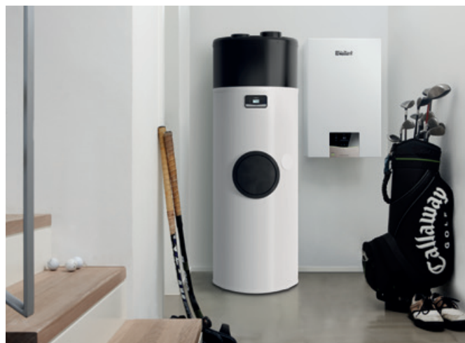
Chauffe-eau thermodynamique aroSTOR et appareil mural à gaz ecoTEC exclusive